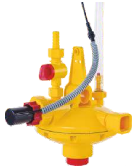
Mit Aktuator für automatisches Spülen

Optional einschraubbare Aktuatoren für automatisches Spülen: Die LUBING Spülsteuerung „LCW Touch Control“ schaltet nacheinander die Aktuatoren, die das integrierte Spülventil des Druckminderers Optima E-Flush öffnen. Die benötigte Spannung wird von der LCW-Steuerung in 24 V DC bereitgestellt. Die Kabellänge der Aktuatoren von 7,5 m sorgt dabei für eine flexible Handhabung. Das manuelle Spülen bleibt aber auch mit Aktuator möglich.