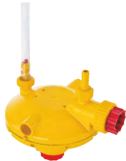
Ohne Aktuator, manuelles Spülen