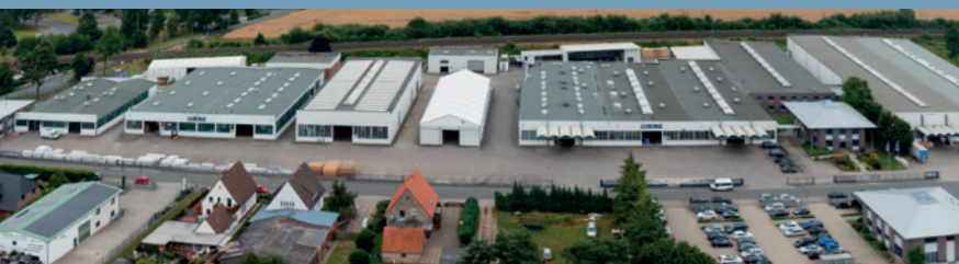
Der Hauptsitz in der Lubingstraße in Barnstorf.

Mit einer Kapazität von über 200 Mitarbeitern bieten wir individuell optimierte Lösungen an.